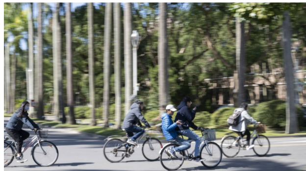
全球各大學都在開展校園永續力的打造工程。國內大學龍頭的台大也積極回應學生倡議。

2020 年 6 月，台灣大學出版自家大學社會責任 ( USR ) 報告書時，不僅公開宣示台大校務基金將排除投資高污染、高排碳企業，