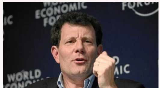
Nicholas Kristof who spoke this week at the NAFSA annual conference.

國的角度來闡述他的言論，敦促聽眾擴大所有學生的機會，讓他們發現“美國可以從其他國家學到什麼”。他還指出，他並不是在談論“在澳大利亞的海灘上閒逛”或“在倫敦或羅馬成群結隊地旅行”。相反的，他說，“充滿同理心的教育……讓人們走出舒適區”。