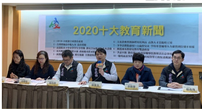
全國教師工會總聯合會今天公布 2020 十大教育新聞。

全教總評選 2020 十大新聞包含「COVID-19 重創全球教育系統」、「合理增加高中職人力迫在眉睫」、「高溫酷暑下中小學學生學習難 教室冷氣應列為基本設備」、「私校轉型方案出爐 轉向私校董事好幾步」、「新教師法正式實施 程序複雜 全教總與你共同面對」、「大專非典型