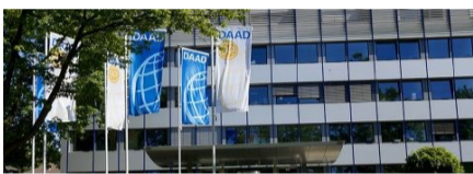
DAAD 總部。

的大學對於其無論是在新冠肺炎期間所面臨的財務和心理問題，或是其一年級國際學生數量表示擔憂。在最近由德國學術交流服務中心 ( DAAD ) 組織的虛擬會議上，大約 100 所大學就國際化及新冠肺炎危機的擔憂及挑戰發表談話，DAAD 主席喬伊布拉托·穆克吉 ( Joybrato Mukherjee ) 說：「我們的幾所會員大學非常擔心其招募及留住他們的國際學生的問題」。