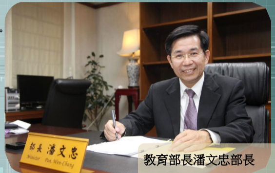
教育部長潘文忠部長

資料來源：高等教育評鑑中心郭玫杏、胡馨文撰。載於聯合新聞網（2020-11-23）。