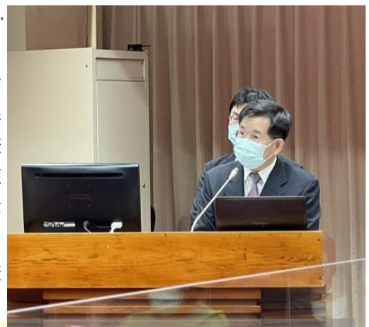
教育部長潘文忠赴立法院備質詢。

潘文忠也指出，公立學校人員增聘屬公務體系，資產也屬於政府；私立學校則是法人性質校產私有，人員任用標準不同，都是未來公私併上需要整合的法律問題，也是最根本的兩大問題。